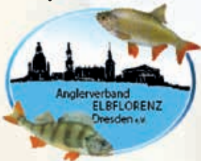
AVE - Anglerverband „Elbflorenz“ Dresden e. V.

Der Landesverband Sächsischer Angler e. V. (LVSA) ist eine anerkannte Naturschutz- und Umweltvereinigung. Er sieht sich als Interessenvertretung für alle sächsischen Anglerinnen und Angler und als unmittelbare Förderinstitution der Angelfischerei. Der LVSA vereint ca. 43.000 Mitglieder in 620 Vereinen und 3 Regionalverbänden: