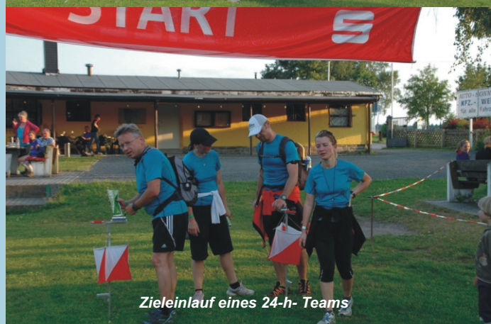
Zieleinlauf eines 24-h- Teams