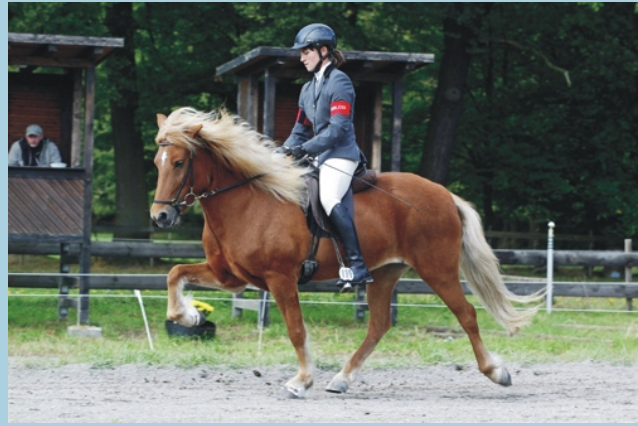
Sól von Chemnitz