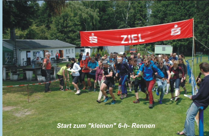
Start zum "kleinen" 6-h- Rennen