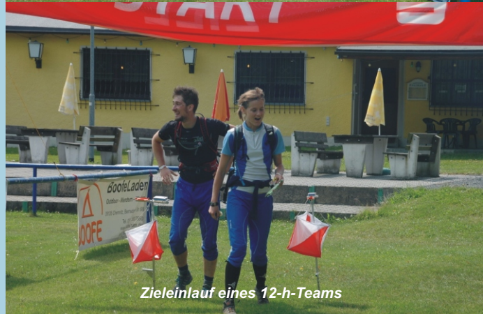
Zieleinlauf eines 12-h-Teams