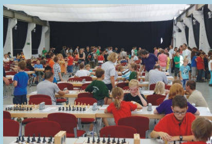
Blick in den Turniersaal

Wir bedanken uns bei den Sponsoren Eins Energie, NILES-SIMMONS Industrieanlagen GmbH Chemnitz, Chemnitz Arena, Sportwerbung A. Dold, Schachartikel Heinz Bunk, Jugendcamp Grömitz und der Sparkasse Chemnitz.