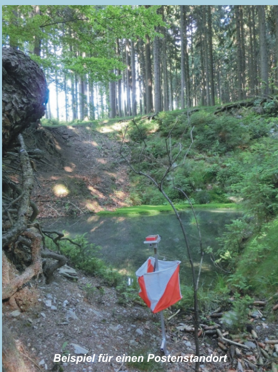
Beispiel für einen Postenstandort