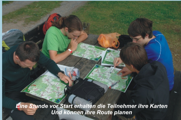
Eine Stunde vor Start erhalten die Teilnehmer ihre Karten Und können ihre Route planen

An einem zentralen Punkt, dem "Hash House", werden warme Mahlzeiten während der Wettkampfzeit gereicht. Die Gruppen können sich dort zwischenzeitlich stärken, ausruhen oder schlafen. Gruppen müssen stets auf Rufweite beieinander bleiben. Sie laufen daher in selbstbestimmter Geschwindigkeit, sodass jeder von Kind bis Großeltern bei diesem Sport Erfüllung erfahren kann. Es bestehen verschiedene Wertungskategorien für die Alters- und Erfahrungs-Level. Abhängig vom Gelände laufen erfahrene Gruppen mehr als hundert Kilometer innerhalb von 24 Stunden. Ergebnisse und nähere Informationen unter: www.Rogaine.de